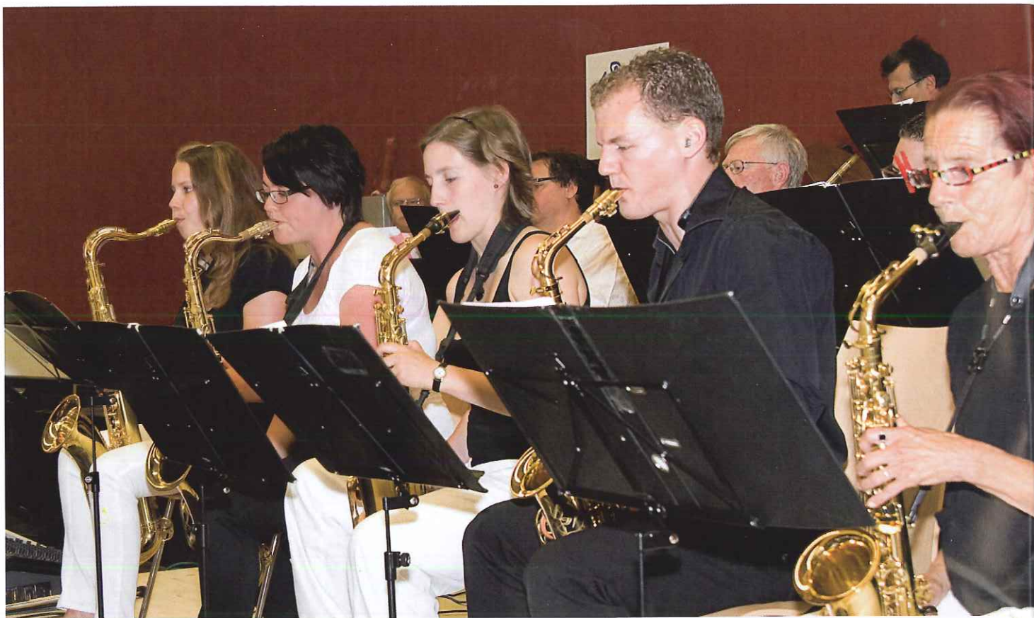
Vielseitig, herzlich und voluminös: Das Opus One Orchestra Laupersdorf setzt an der Delegiertenversammlung 2012 des Kantonal-Solothurnischen Gewerbeverbandes (kgv) musikalische Akzente.